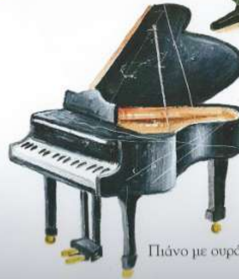
Πιάνο με ουρά