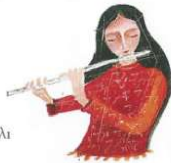
Φλάουτο (τρόπος παιξίματος)